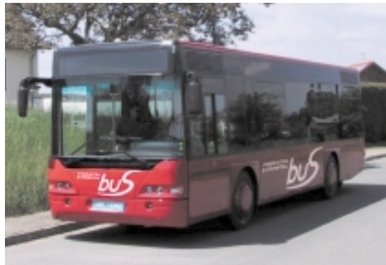
Fährt im Viertelstundentakt: der Stadtbus im österreichischen Dornbirn

Am Beispiel Stadtbus Dornbirn mit seinem 212 Kilometer langen Liniennetz, 18 Bussen und 280 Haltestellen wird deutlich, dass eine konstante Verbesserung des ÖPNV-Angebotes auch eine stetige Steigerung der Fahrgastzahlen mit sich bringt: von gut zweieinhalb Millionen Personen im Jahr 1992 fast eine Verdoppelung auf knapp fünf Millionen 2001. Seit einem Jahr verkehrt der Stadtbus Dornbirn im Viertelstundentakt. 2003 soll ein Versuch starten, den Takt noch weiter zu reduzieren: auf den Hauptverkehrsachsen wird ein 5-min-Takt angeboten, um noch mehr Fahrgäste zu erreichen.