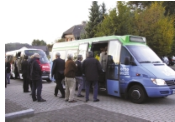
Die Teilnehmer/innen starten zur Besichtigung des VlothoBusses

Vertreten sind zwar alle Altersklassen. Den Löwenanteil haben aber die 19- bis 64-Jährigen. 36 Prozent aller Nutzer sind Rentner, 19 Prozent Vollzeit- und 14 Prozent Teilzeitbeschäftigte, 18 Prozent Schüler und Studenten. Beschäftigte, Schüler und Studenten machen einen wesentlichen Teil der Abo-Kunden aus. Überwiegend nutzen die Fahrgäste den TaxiBus, um von der Wohnung aus ihr Ziel zu erreichen (59 Prozent). Die meisten kehren auch dorthin per ÖPNV zurück. 16 Prozent kommen von der Arbeit, ledig-