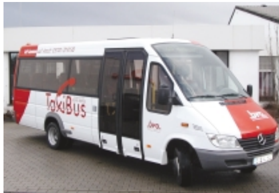
Kommt auf Anruf: der TaxiBus in Stemwede und Preußisch Oldendorf

Zur Veränderung des Modal-Splits kann der Taxibus mit seinem geringen Anteil am ÖPNV kaum beitragen. Der ÖPNV insgesamt macht in ländlichen Regionen ohnehin nur 3 bis 6 Prozent aller Wege aus. Ein Stadtbussystem könne aber – so ein Beispiel aus den Reihen der Tagungsteilnehmer – in Städten für eine deutlich bessere Verteilung der Verkehre sorgen, ausgerichtet auf Dienstleistungen und den Einzelhandel. Die Spitze des Individualverkehrs ließe sich durch den Taxibus nicht reduzieren, dazu ist ein qualitativ hochwertiges System wie der Stadtbuss erforderlich.