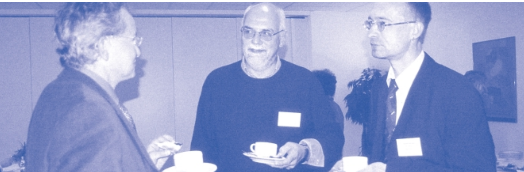
Texte: Ingrid Schütte Gestaltung: Thorsten Ellermann, Büro für Gestaltung, Bielefeld