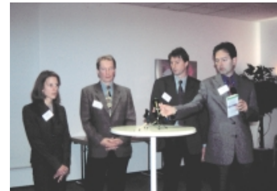
"Stimmen die Rahmenbedingungen?" Die Referenten/innen diskutieren mit dem Plenum

Wird von Wettbewerb gesprochen, stehen Strukturen auf dem Prüfstand: Können kommunale und private Verkehrsunternehmen überhaupt in einen fairen Wettbewerb eintreten? Beispiele konnten Tagungsteilnehmer sowohl für die eine als auch die andere Unternehmensform beibringen und auch für eine gelungene Symbiose, um die Kosten in den Griff zu bekommen. Dennoch schien insgesamt die Sorge durch, eine allen Seiten gerecht werdende Ausgangsbasis zu finden.