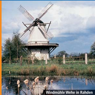
Windmühle Wehe in Rahden

350 Kilometer der „BahnRadRoute Weser-Lippe“ trennen den Bremer Roland vom Paderborner Dom. Folgen Sie den alten Hansewegen: quer durch das Herz Niedersachsens mit dem Landkreis Diepholz, dem reizvollen Mühlenkreis Minden-Lübbecke, das Wittekindsland Herford und anschließend in die ehemalige Leineweberstadt Bielefeld, heute geprägt von großstädtischem Flair. „Erfahren“ Sie die reizvolle Umgebung des Lipperlandes mit den sanften Höhenzügen des Teutoburger Waldes bis ins Paderborner Land. Was Sie erwartet sind wunderschöne Parks, imposante Gutsanlagen, romantische Höfe und ein eindrucksvolles Panorama von Wiehengebirge, Teutoburger Wald und Egge. Die längste, aber auch abwechslungsreichste der drei BahnRad-Routen!