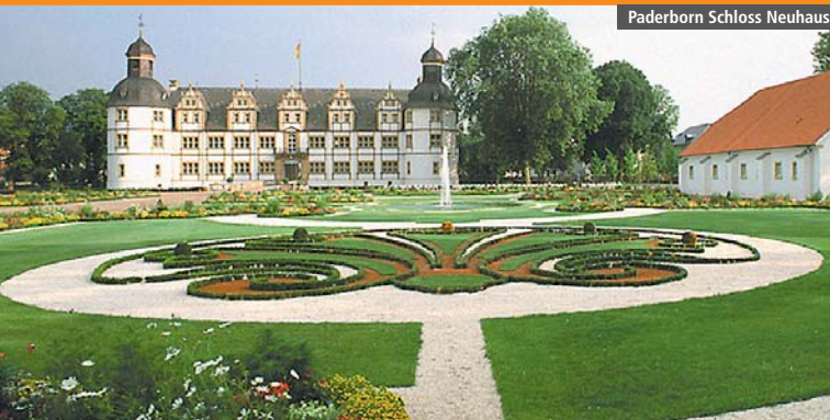
Paderborn Schloss Neuhaus

»» jetzt auch samstags »» jetzt Anschluss nach Bielefeld und Osnabrück »» Tickets für Bus und Bahn beim PiumBus-Fahrer